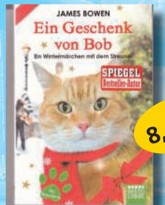
Weihnachten bei den Tieren