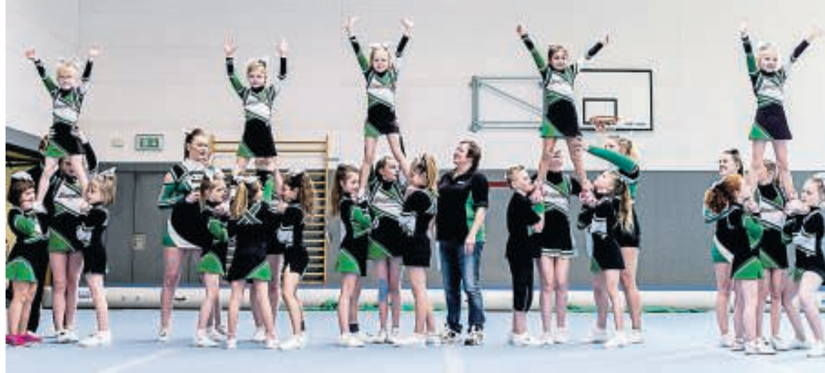
Die Mosquitos sind das Meisterschafts-Pee-wee-Team des MTV Salzgitter. Es soll in Hamburg hauptsächlich Wettkampferfahrung sammeln.